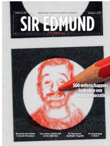
Afbeelding 1: De Volkskrant, 18 februari 2017