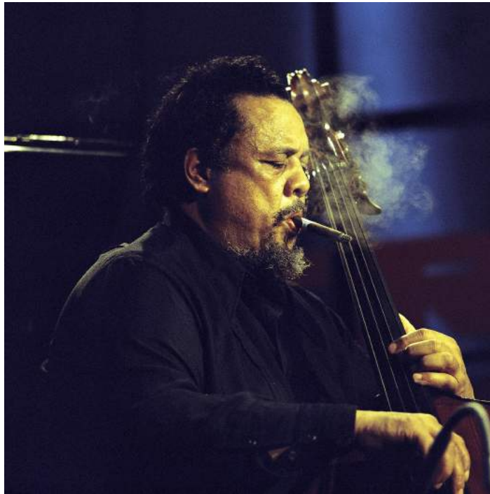
Afbeelding 6: Charles Mingus (1922-1979)

improvise on nothing man; you've gotta improvise on something , aldus de Amerikaanse contrabassist en jazzlegende Charles Mingus.