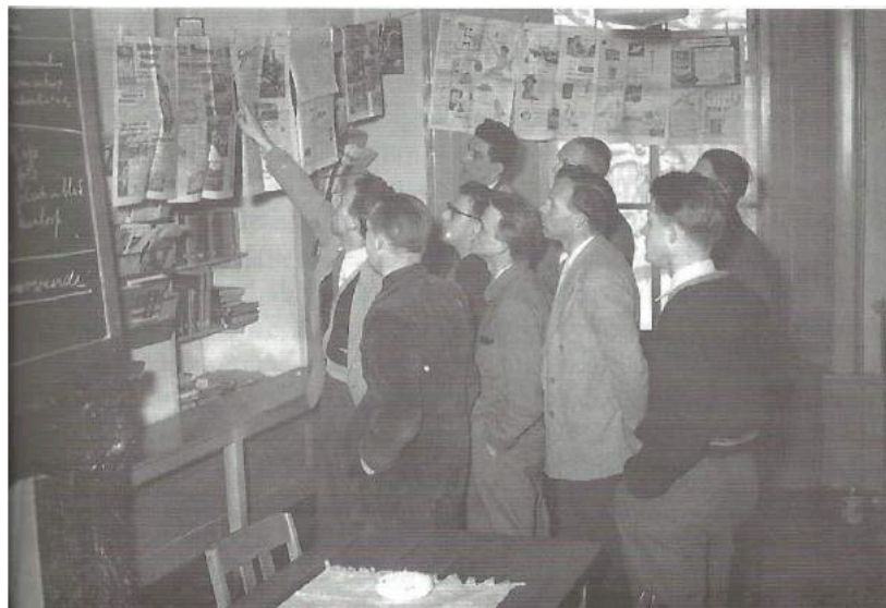
Afbeelding 4: Kritisch de krant lezen, Volkshogeschool Eerbeek, 1956

Een Nederlands voorbeeld van zo'n democratische praktijk vormt de Algemene Volkshogeschool Kursus (AVK) voor mannen in de volkshogeschool van Eerbeek in 1956 (Van der Linde & Frieswijk 2013: 206-213).