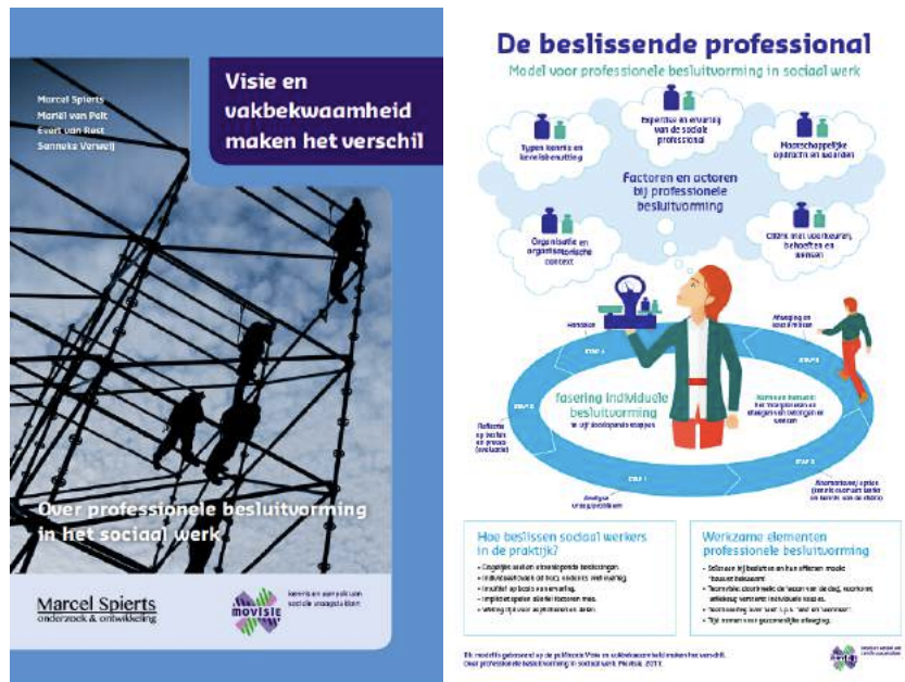
Afbeelding 5: Het onderzoek 'Professionele besluitvorming in het sociaal werk'

We ontdekten dat professionele besluitvorming binnen het sociaal werk vooral een individuele aangelegenheid is. Er is wel veel overleg, bijvoorbeeld met collega's, met het team of met de teamleider, maar dat neemt niet weg dat de professional zelf besluiten neemt over zaken die direct het contact met de cliënt, deelnemer of vrijwilliger betreffen. Ook de casuïstiekbespreking in het teamoverleg leidt zelden tot 'teambesluitvorming' over de wijze van handelen. De 'waan van de dag' speelt een belangrijke rol in professionele besluitvorming. Dat wil echter niet zeggen dat sociale professionals niet serieus, integer en zorgvuldig te werk gaan. Vier bevindingen uit het onderzoek vallen op, zaken die ook cruciaal zijn bij het bepalen van de ruimte voor democratisch sociaal werk.